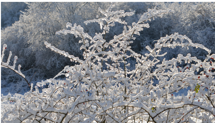
Merci à celles et ceux qui déploient des trésors d'imagination et de création pour assurer la décoration du village et merci à Philippe Levieux pour ces photos.