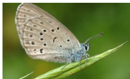
Azuré de la Gentiane Croisette.

chenilles vont se nourrir dans le premier cycle de leurs vies. Le développement secondaire de ces chenilles (3) dépend également d'une espèce unique et spécifique de fourmis (4) qui vont littéralement les « adopter et élever » en les nourrissant comme leurs propres larves(5). Au bout du cycle après un passage sous forme de chrysalide(6), un papillon (7) sort d'une fourmilière !